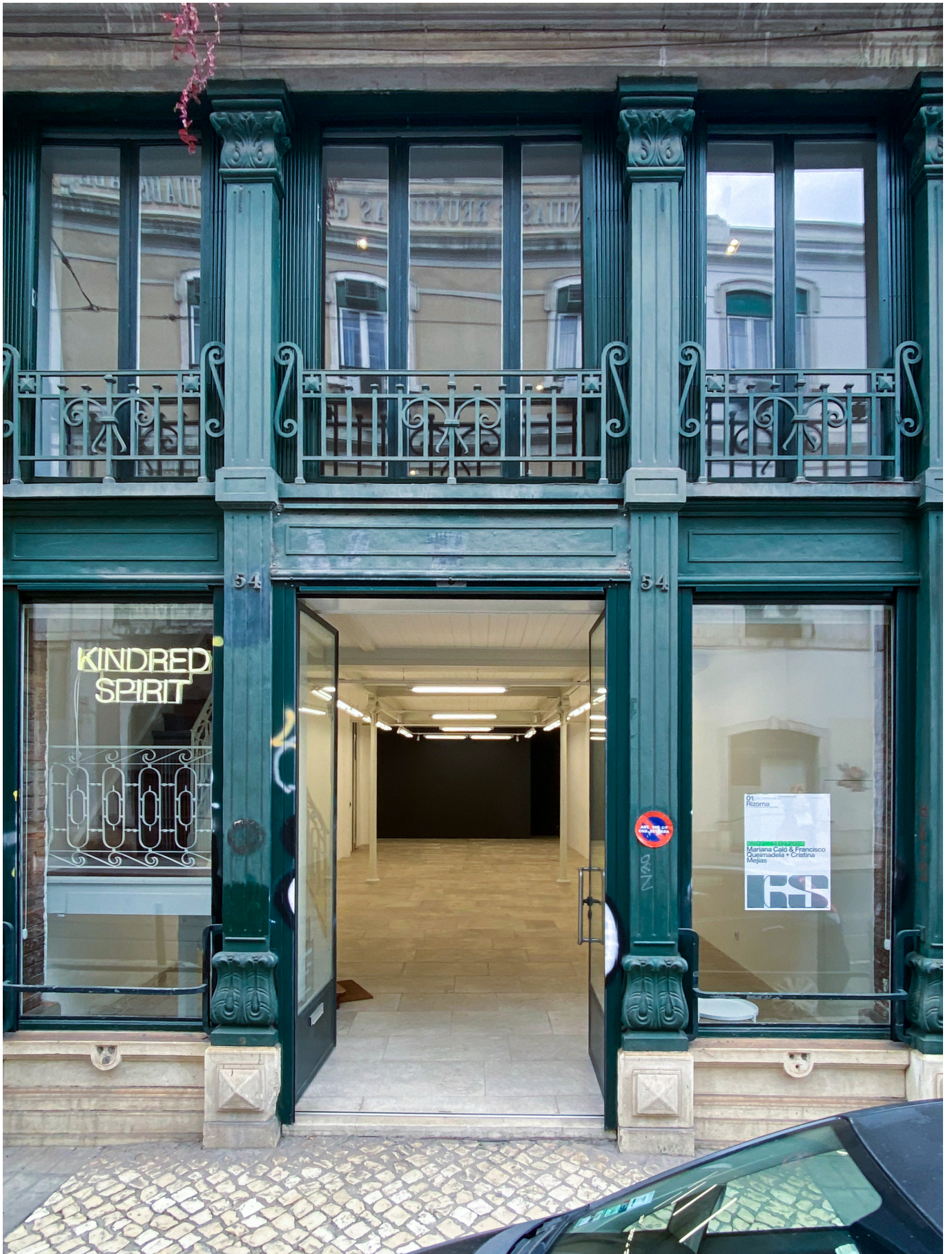
Kindred Spirit Vista Exterior del Espacio