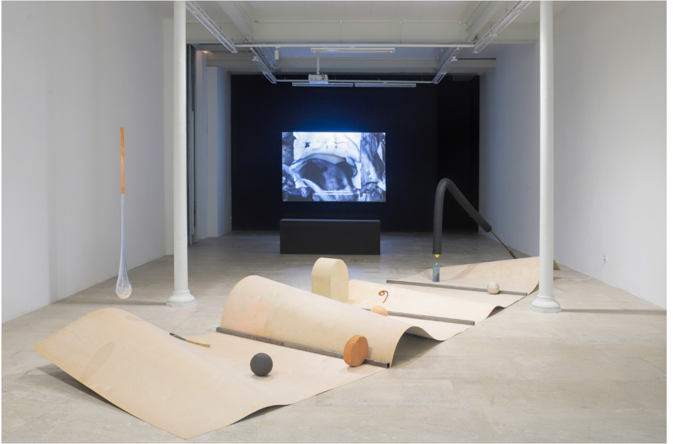
Rizoma / Rhizome Vista de la exposición