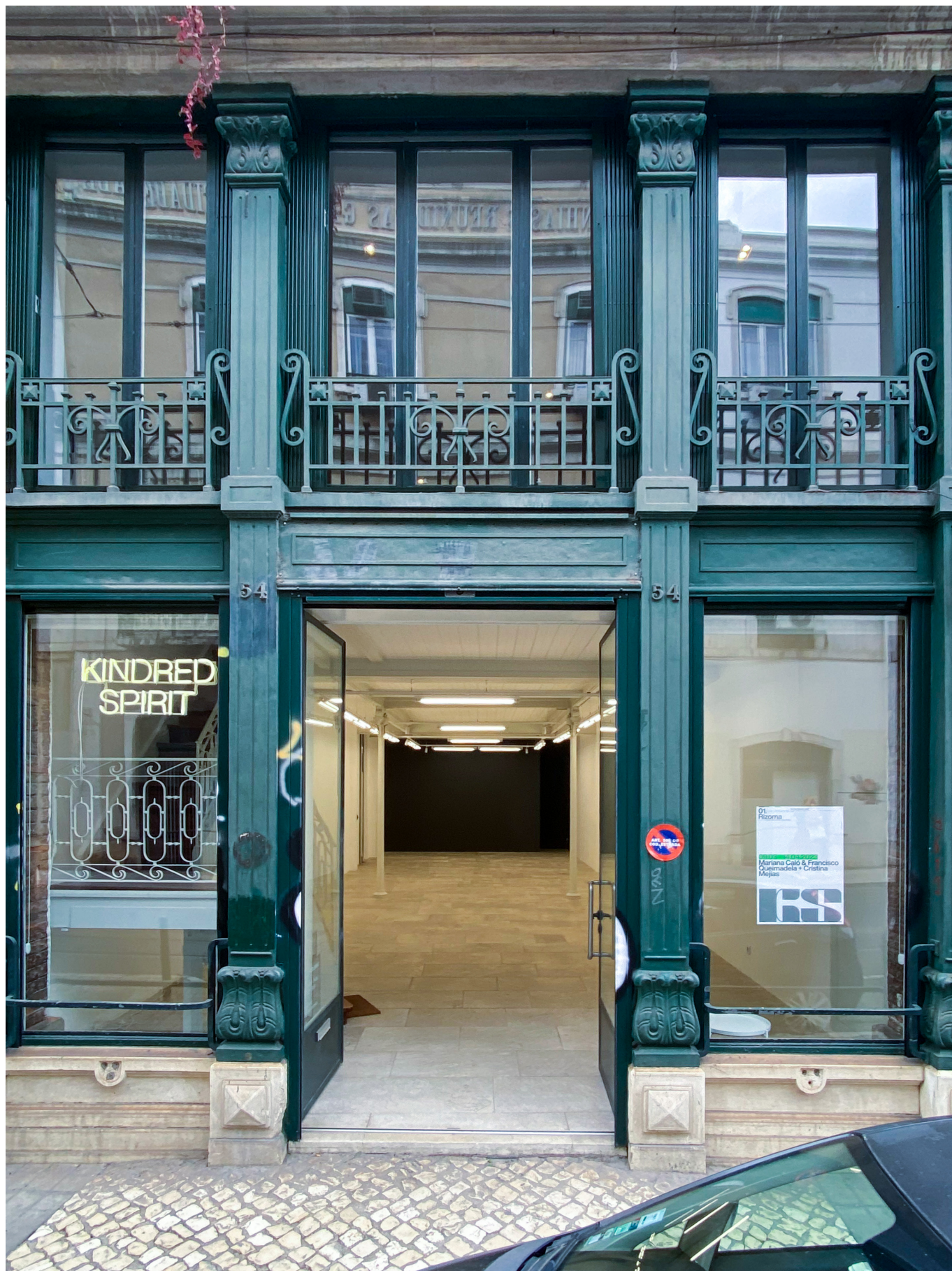
Kindred Spirit Vista Exterior do Espaço