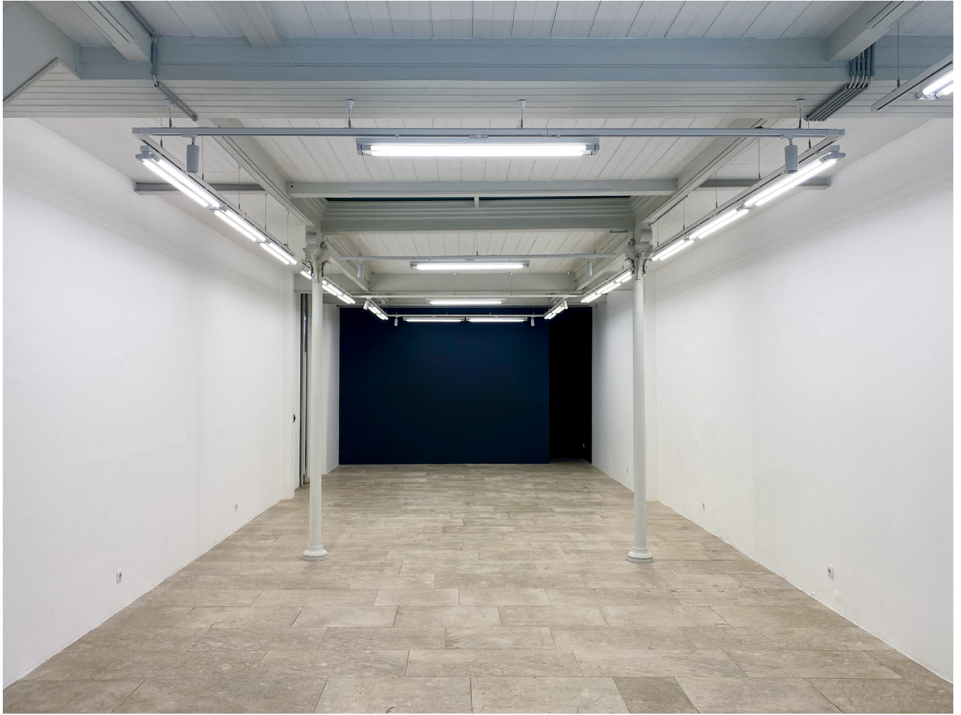
Kindred Spirit Vista Interior do Espaço